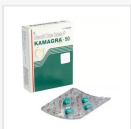
KAMAGRA-50 MG €16.00