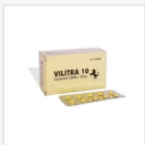
VILITRA-10 MG €16.00